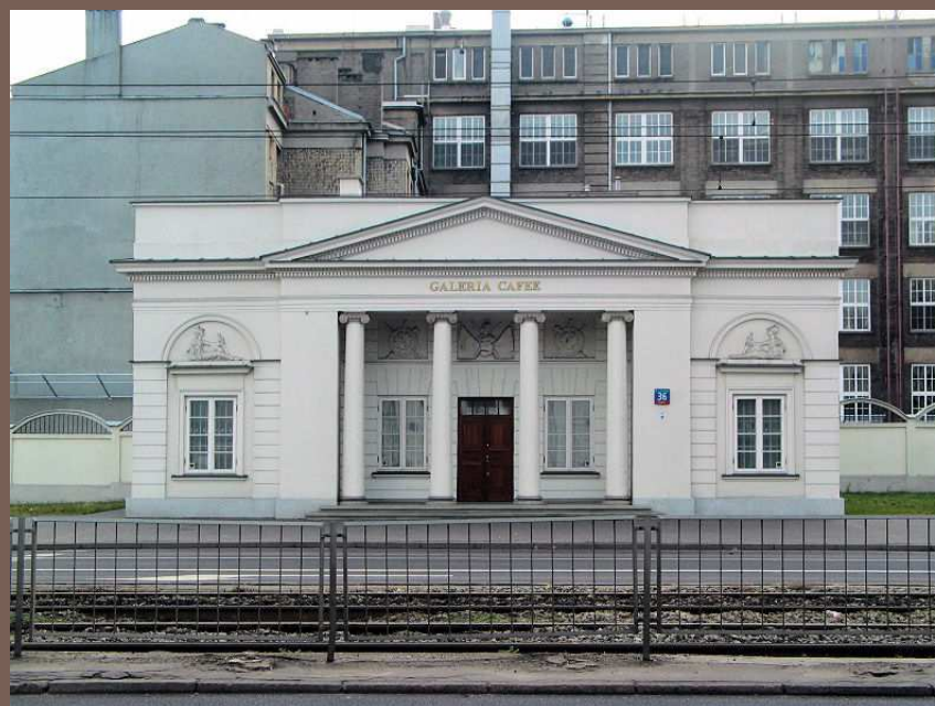
Rogatka południowa w 2006 roku.

PRZY POSZERZANIU ULIC ZAMOJSKIEGO I GROCHOWSKIEJ W 1961 ROKU PRZESUNIĘTO O 10,5 METRA ROGATKĘ PÓŁNOCNĄ, A W ROKU 2001 O 8 METRÓW ROGATKĘ POŁUDNIOWĄ. OBIE ROGATKI SĄ POZOSTAŁOŚCIĄ „OKOPÓW LUBOMIRSKIEGO”. WZNIESIONO JE W 1823 ROKU WEDŁUG PROJEKTU JAKUBA KUBICKIEGO. PRZETRWAŁY NIEZNISZCZONE.