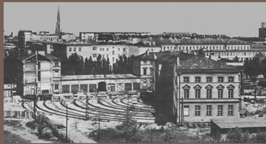
Pałac Lubomirskich przed i po obróceniu.