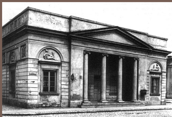
Rogatki północna przed 1939 rokiem i rogatka południowa w 1914 roku