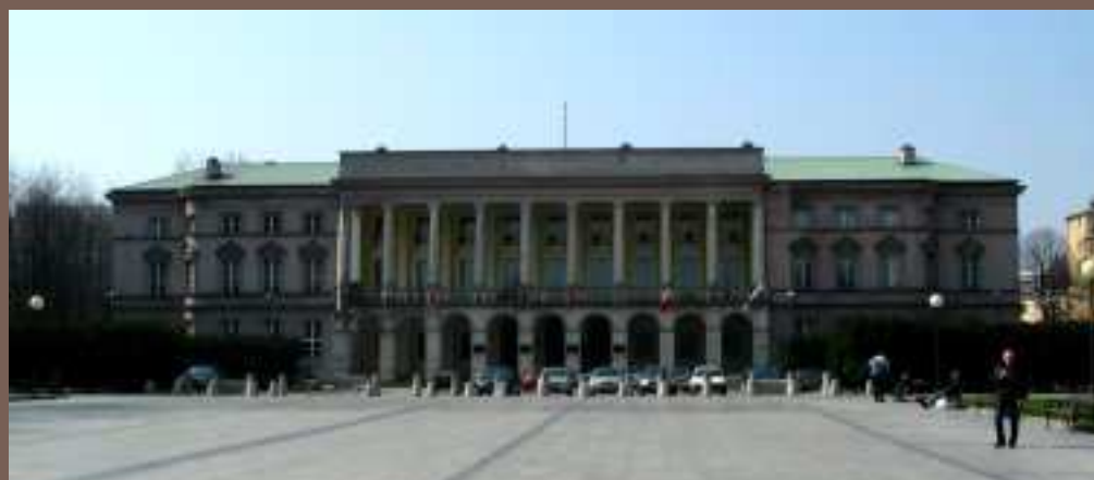
Pałac Lubomirskich w 2006 roku.

WRAZ Z PLANAMI BUDOWY „OSIEDLA ZA ŻELAZNĄ BRAMĄ” PODJĘTO DECYZJĘ O OBRÓCENIU PAŁACU LUBOMIRSKICH TAK, ABY SWĄ BRYŁĄ ZAMYKAŁ PERSPEKTYWĘ OGRODU SASKIEGO. PAŁAC ODCIĘTO OD OFICYN I FUNDAMENTÓW I PO UŁOŻONYCH TORACH PRZESUWANO NA NOWE MIEJSCE OD 30 MARCA DO 18 MAJA 1970 ROKU.