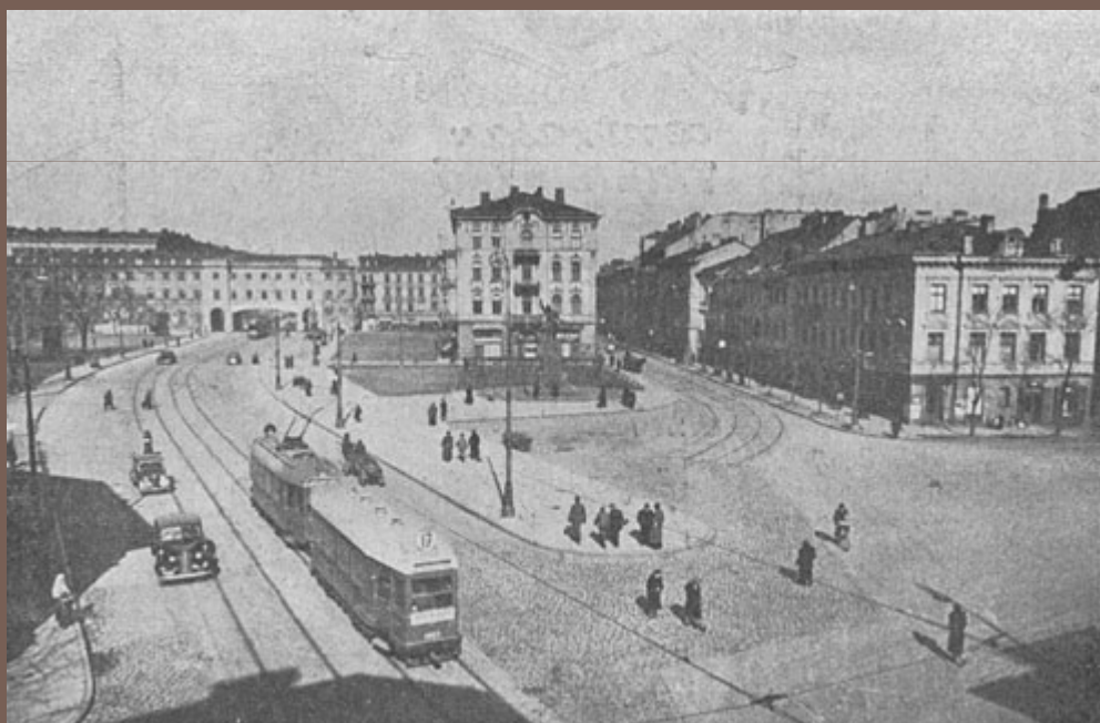
Plac Krasińskich po zmianie organizacji ruchu. Rozebrane tory tramwajowe w kierunku ul. Nowiniarskiej.