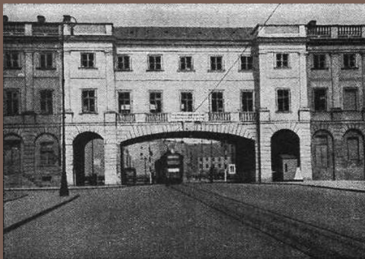
Przejazd pod gmachem Sądu Okręgowego.

W ROKU 1937 PRZEBUDOWANO FRAGMENT GMACHU SĄDU OKRĘGOWEGO PRZEBIJAJĄC W JEGO ŚRODKOWEJ CZĘŚCI PRZEJAZD W KIERUNKU POWSTAJĄCEJ ULICY BONIFRATERSKIEJ. PRZENIESIONO RÓWNIEŻ TORY TRAMWAJOWE.