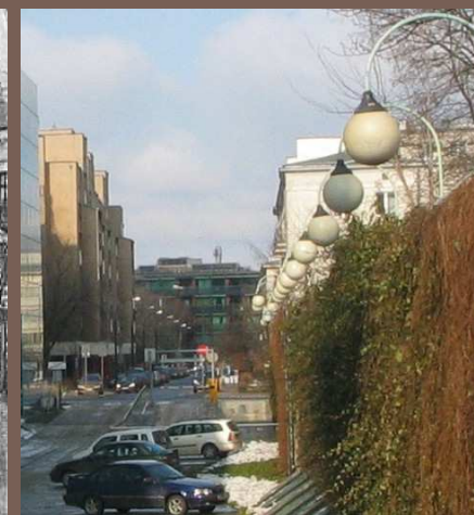
Warszawa 2010 r.