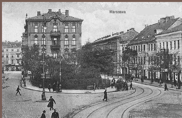
Warszawa ok. 1914 r.

JEŻELI ODGADNIECIE PAŃSTWO, JAKA TO ULICA, PRZEJDIEMY DO WŁAŚCIWEJ ZAGADKI. W TYM GMACHU OD STRONY ZAPLECZA ZLOKALIZOWANA JEST CIEKAWA FORMA ARCHITEKTONICZNA. MOŻNA JĄ SZCHARAKTERYZOWAĆ TRZEMA SŁOWAMI: KOBIETY, CIĘŻARY, WODA. I TERAZ JUŻ PYTANIE KONKURSOWE. CO TO ZA FORMA, W JAKIM OBIEKCIE I PRZY JAKIEJ BYŁEJ ULICY.