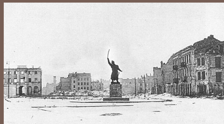
Warszawa 1945 r.