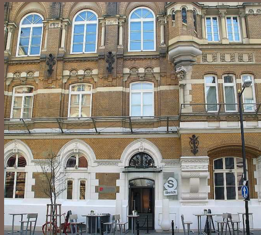
Ul. Foksal nr 19 - kamienica neogotycka z 1897 r. – zimowa siedziba Warszawskiego Towarzystwa Wioślarskiego