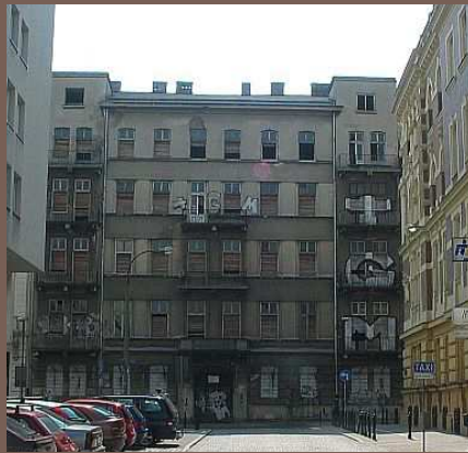
Ul. Foksal nr 13 - zabytkowa kamienica z przełomu XIX i XX wieku