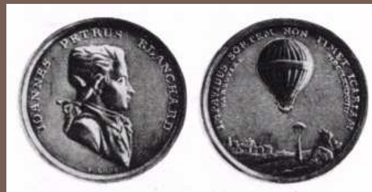
Medal bity na cześć pierwszego lotu balonowego Blancharda w Polsce, Źródło: Andrzej GLASS "Polskie skrzydła", Interpress, Warszawa 1984