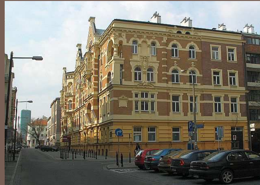
Ul. Foksal nr 16 - siedziba Teatru Sabat

W latach 60. XX wieku planowano przebić przez Foksal przedłużenie ulicy Kopernika, która miałaby stać się nową arterią komunikacyjną mającą na celu odciążenie Nowego Świata. Wyburzeniu uległyby wtedy kamienice nr 13 i nr 15. Pomysłu nigdy nie zrealizowano, jednak kamienice pozostawiono zaniedbane i dopiero współcześnie planuje się ich rewitalizację.