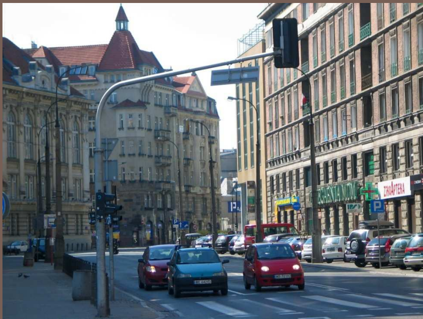
Ulica Koszykowa. Odcinek środkowy.