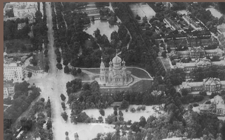
Cerkiew wojskowa św. Michała Archanioła.

ARCHITEKT: W. POKROWSKI. BUDOWA: 1892-94. MUROWANA ŚWIĄTYNIA POWSTAŁA NA POTRZEBY LITEWSKIEGO PUŁKU LEJBGWARDII, KTÓREGO KOSZARY ZNAJDOWAŁY SIĘ PO DRUGIEJ STRONIE AL. UJAZDOWSKICH. ROZEBRANA: ZAMKNIĘTA W 1915, BRAK KONSERWACJI DOPROWADZIŁ DO KONIECZNOŚCI ROZBIÓRKI, KTÓRA NASTĄPIŁA W 1923.