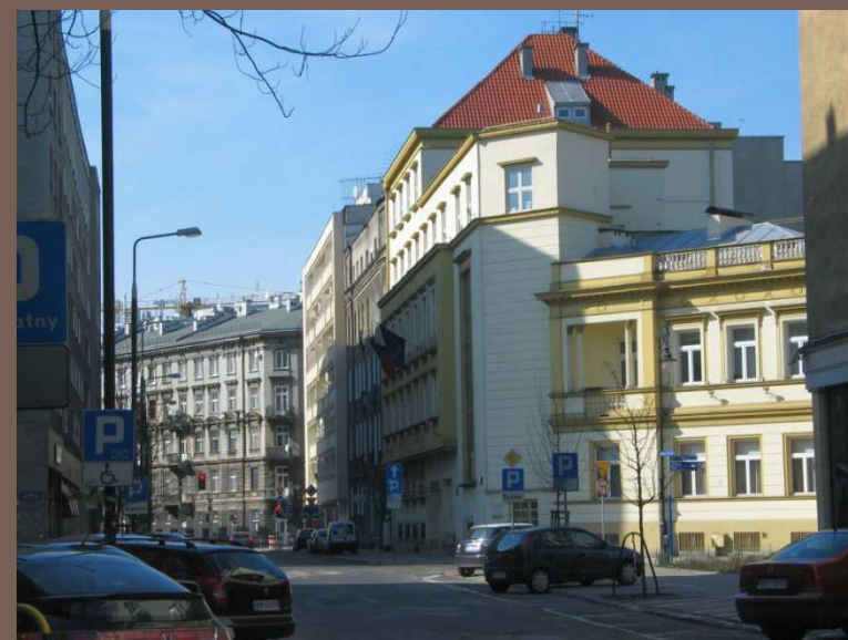
Ulica Koszykowa. Odcinek wschodni.

NA POCZĄTKOWYM ODCINKU OD PLACU NA ROZDROŻU DO PLACU KONSTYTUCJI ULICA KOSZYKOWA ZACHOWAŁA ZWARTY CHARAKTER ZABUDOWY. CZĘŚĆ KAMIENIC OCALAŁA W CZASIE WOJNY, NA MIEJSCU ZNISZCZONYCH WZNIESIONO BLOKI MIESZKALNE. W KAMIENICY NA ROGU UL. KOSZYKOWEJ Z ALEJĄ PRZYJACIÓŁ MIESZKAŁ JERZY WALDORF, CO UPAMIĘTNIA WMUROWANA TABLICA. NAROŻNA KAMIENICA NR 24 NIEZNACZNIE UCIERPIAŁA PODCZAS WOJNY I DZIŚ MOŻEMY PODZIWIĄĆ JEJ BOGATE ELEWACJE. W TEJ KAMIENICY NA 4 PIĘTRZE MIESZKAŁ I TWORZYŁ WYBITNY MALARZ KONRAD KRZYŻANOWSKI. NA ODCINKU MIĘDZY UL. MOKOTOWSKĄ I PL. KONSTYTUCJI MIEŚCI SIĘ BIBLIOTEKA PUBLICZNA.